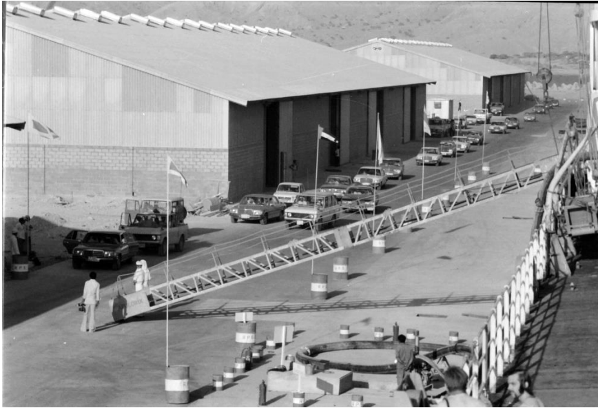
De kolonne van de Emir van Ras al Khaimah bij aankomst bij het schip.

Tegen alle scheepsvoorschriften in kwamen er ook met vuurwapens behangen militairen mee aan boord.